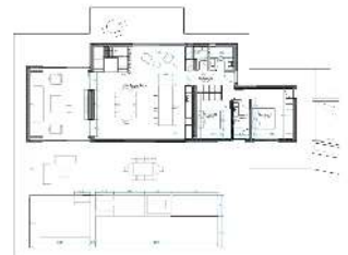
Planta 1a sra