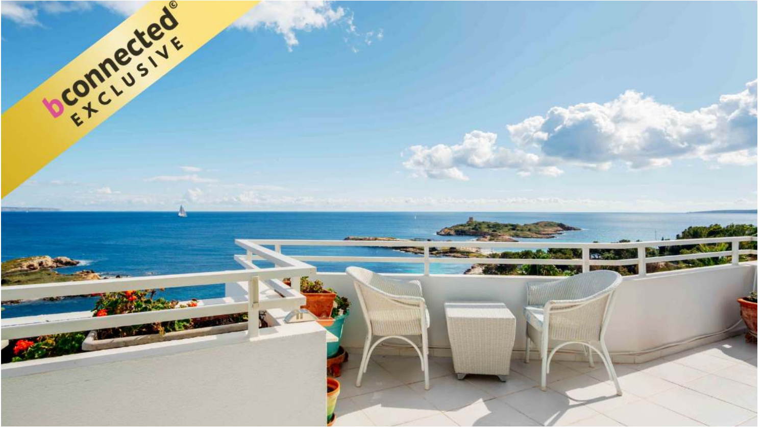
Dream sea view apartment in Paseo de Illetas