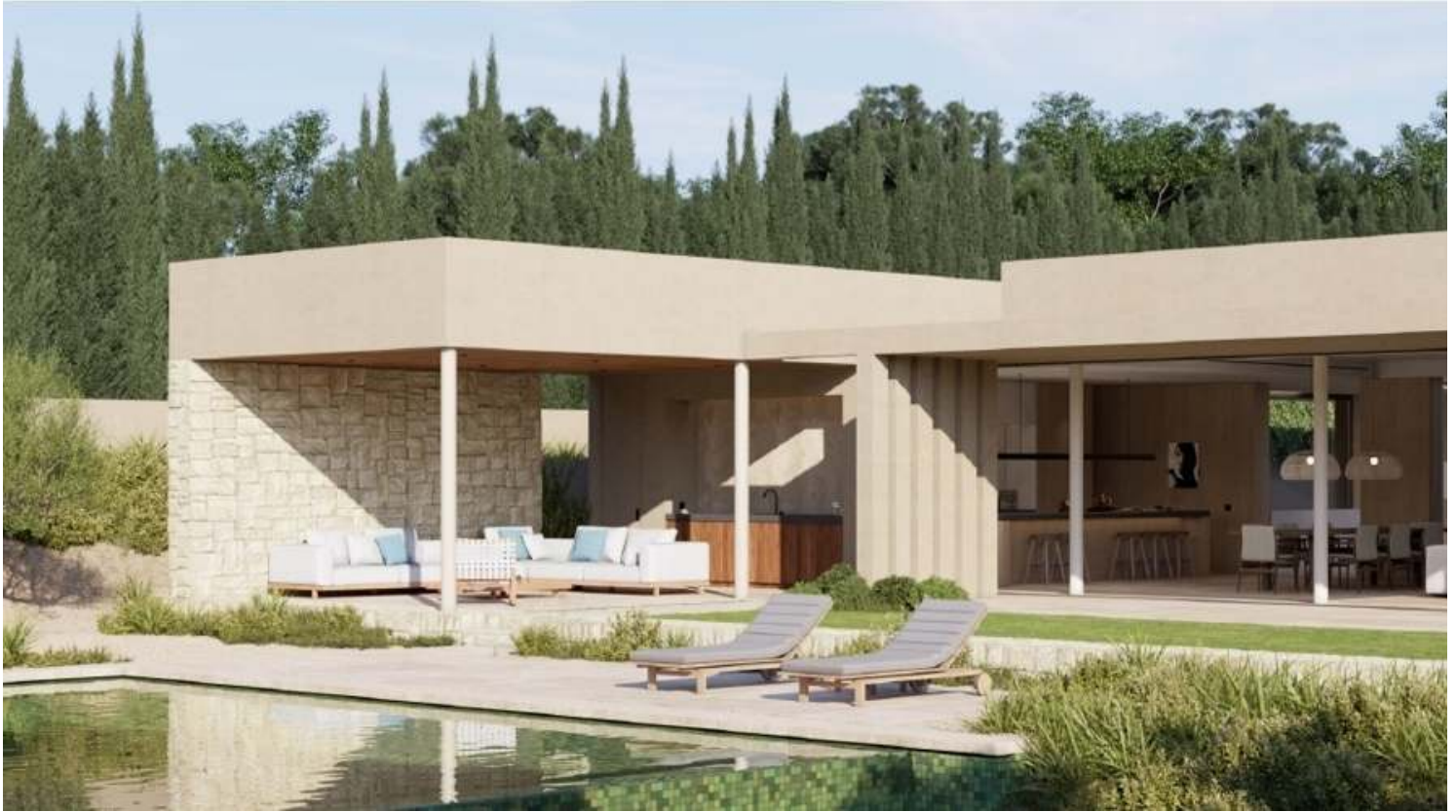
Modern Luxury Villa in Son Vida