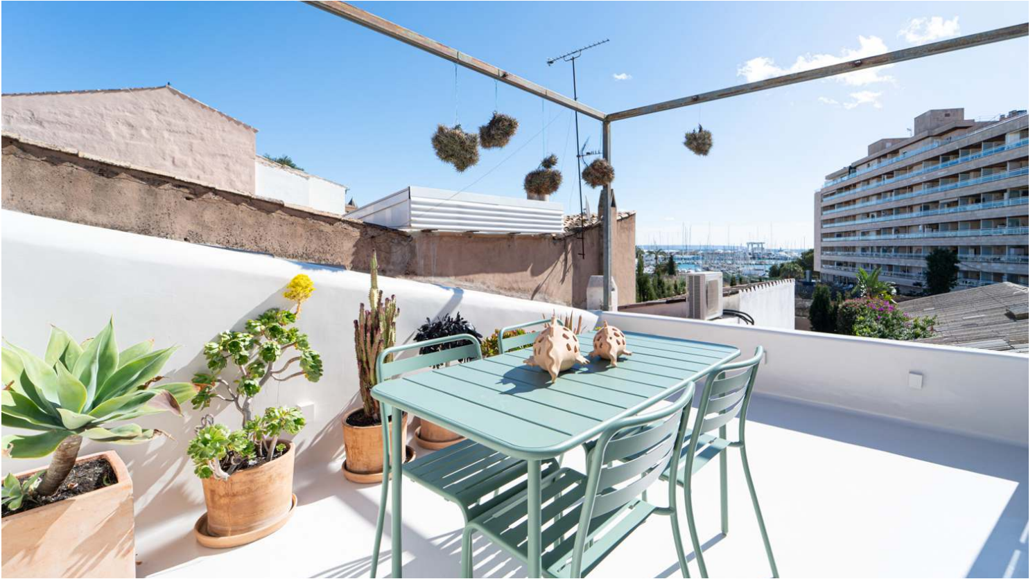
Charming townhouse in Es Jonquet with terrace and patio