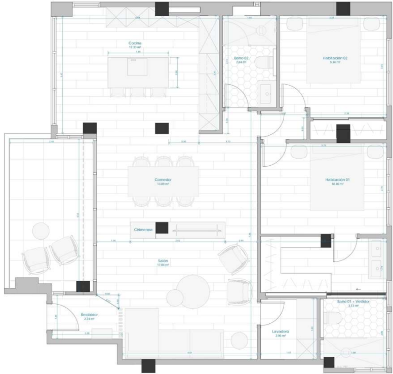
PLANTA PROPUESTA DISTRIBUCIÓN OPCION B-01 E 1/25