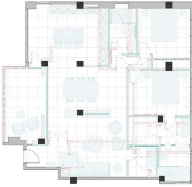
PLANTA DEMOLICIÓN + NUEVA CONSTRUCCIÓN E 1/50