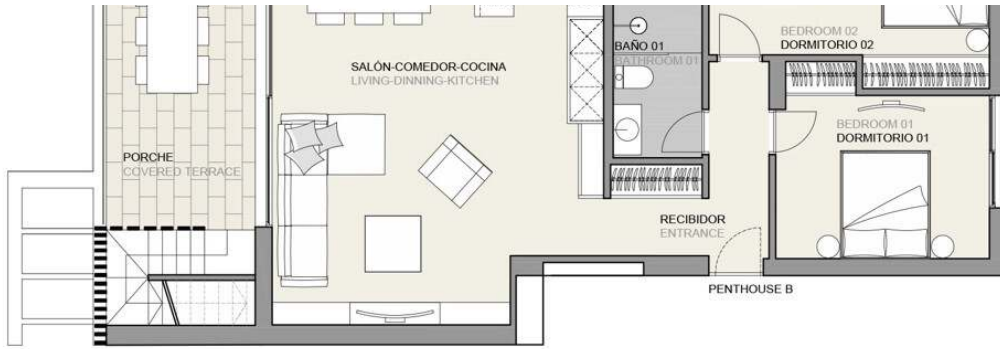
PENTHOUSE APARTMENT B