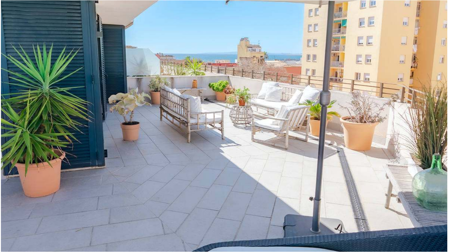
Duplex Penthouse with Terrace & sea views in Portixol