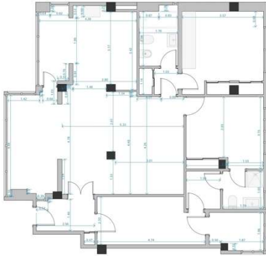
PLANTA ESTADO ACTUAL E 1/50