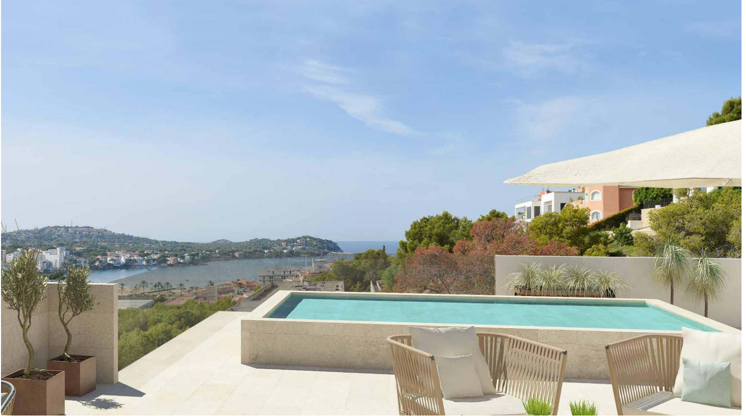
Penthouse with private rooftop and pool in Sta Ponça