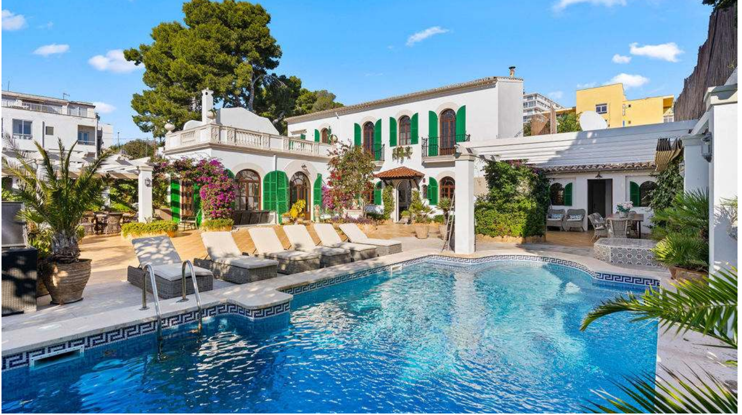
"Mama Mia Villa" - Mediterranean Dream home with seaviews