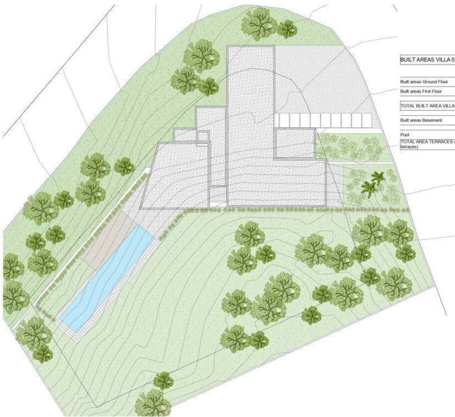
BUILT AREAS VILLA 03