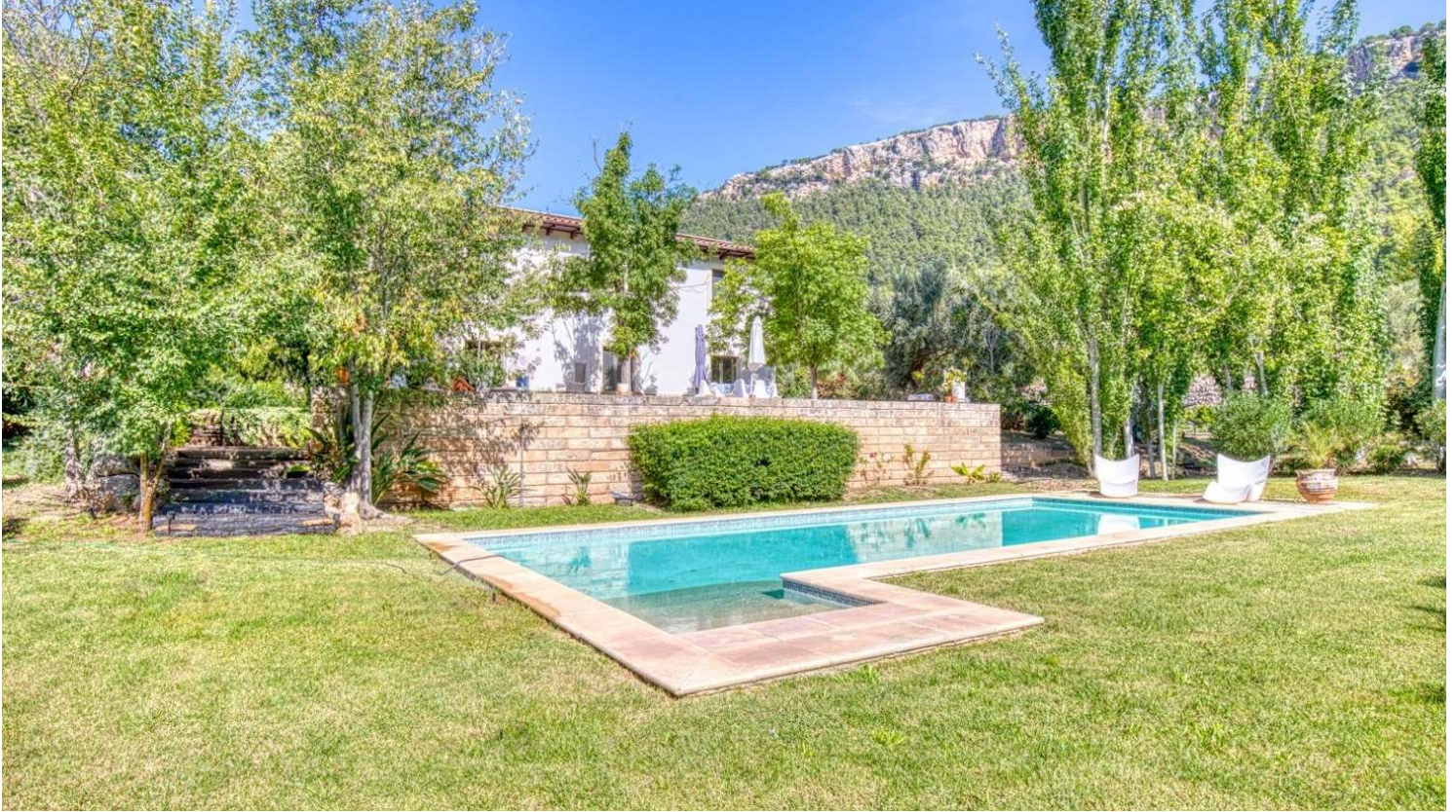
Exquisite Villa in Esporles, Son Cabaspre.